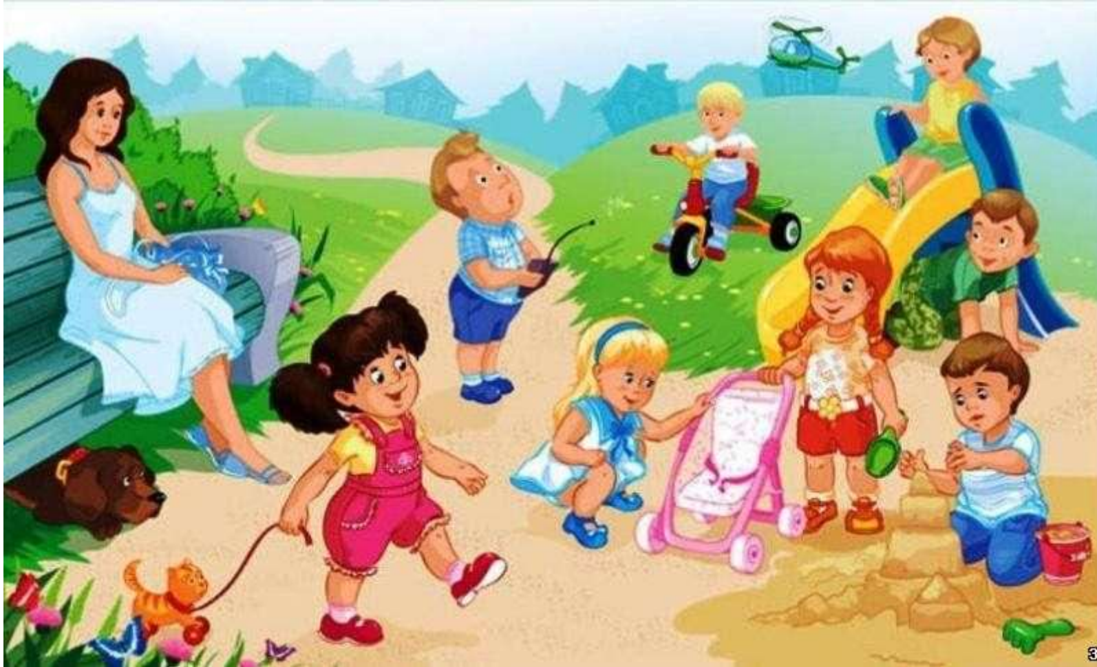
Сокровища в песочнице